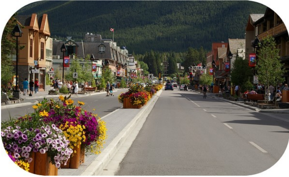
Banff, den "friserede" vintersportsby.

Dernæst kørte vi nordpå til Lake Louise, vi prøvede forgæves om vi kunne få en plads på byens eneste campingplads. Så overvejede vi nogle alternativer.. Fredag aften er der formentlig run på alle steder. Vi endte med at køre 14 kilometer uden for byen ad den gamle hovedvej til Banff, hvor vi fandt plads på en skovcampingplads med toiletbygning som eneste facilitet. Merete tændte bål på den indrettede bålplads, det er næsten ligesom at være på arbejde sagde hun, og lavede bøffer over ild. Bålet blev ved med at brænde rigtig længe. Træet var noget vi (ups) var kommet til at tage med fra USA.