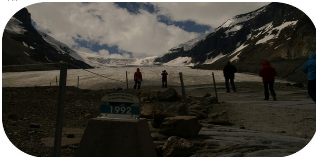
Gletcheren med markering for iskanten i 1992.

Snart efter kom vi til Columbia Icefields. Vi gik ad stien op til gletsjeren. Den var imponerende stor, meget smuk, men også lidt snavset af tidens tand. Vi kunne også se nogle steder, hvor den havde kælvet, og her havde gletsjeren en smuk isblå farve. Skilte markerede med årstal hvor langt gletsjeren havde trukket sig tilbage i løbet af de sidste ca. 100 år. (1890, 1935, 1948, 1982 og 1992). Bare i dette område var der 30 gletsjere. Vi havde også på vejen set flere skilte, der oplyste om lavineskred.