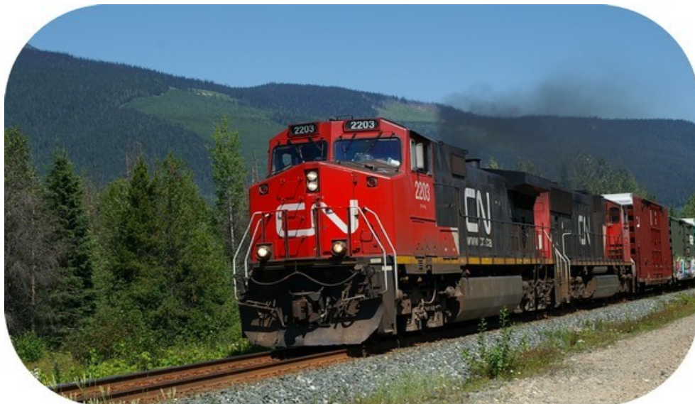
Godstog, vi måtte vente nogle minutter på at passere jernbaneoverskæringen.

På en stor strækning langs Highway 5 var der igen tegn på skovbrand på begge sider af vejen. Det er pudsigt at se, hvordan det pibler tæt frem med nye træer i akkurat samme højde. Nåletæer skulle have den evne, at de smider deres frø ved skovbrand for at sikre sig artens overlevelse. Helt nøjagtigt hvordan det foregår, har jeg ikke haft tid/mulighed for at undersøge. Men det kunne jo være én eller flere af vore læsere har en viden på det felt!