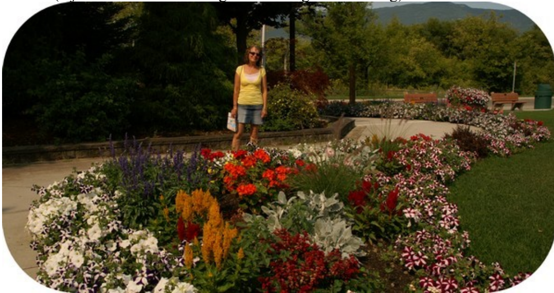
Parken ved søen i Salmon Arm.