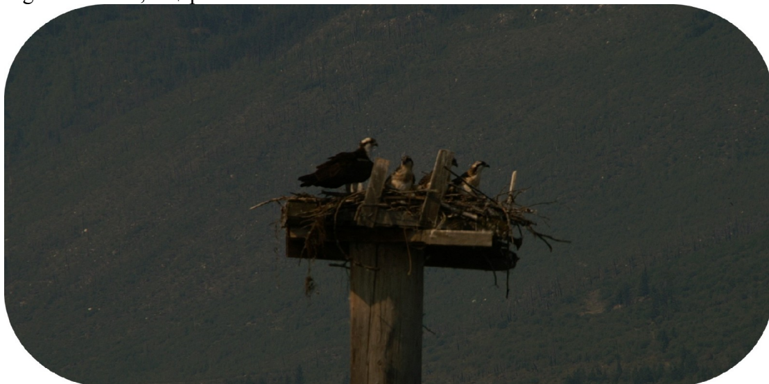
Fiskeørnerede med 3 unger.

Merete og jeg valgte at gå en tur ned til den lille lystbådehavn. Der var rigtig hyggeligt, der var en lille park virkelig flot vedligeholdt med masser af forskellige blomsterbede. Helt nede ved vandet var der en fiskeørnerede med unger. Vi brugte meget tid med at studere og fotograferede fuglene, det så flot ud, når de dykkede fra stor højde næsten lodret mod vandet for at fange fisk. Der var også nogle kæmpe karper i vandet. Efter en god times tid ved vandet gik vi op til byen og fandt posthuset, Merete havde nogle postkort klar til afsendelse. Men frimærker til Europa for postkort er en dyr sag i Canada. 1,90 $ pr. stk. Det er næsten 12 danske kroner.