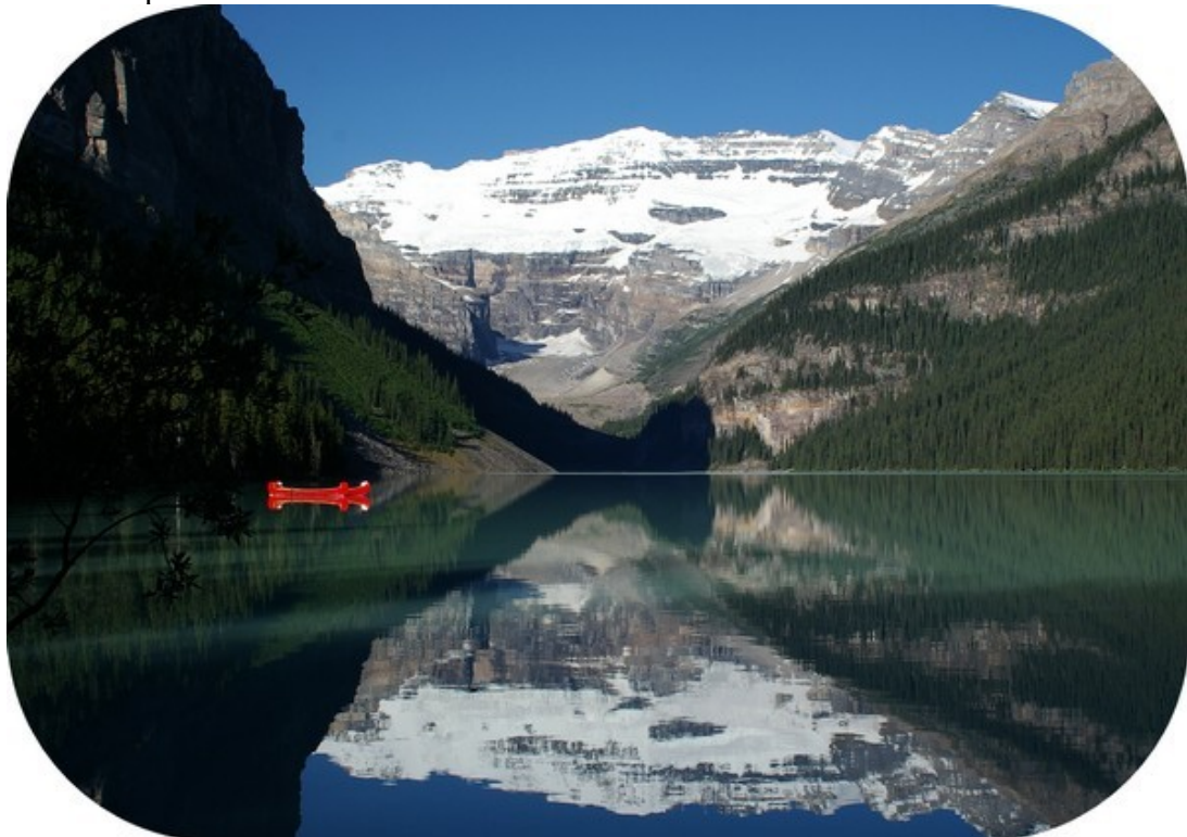
Spejlbillede af Lake Louise (vender det mon på hovedet?).