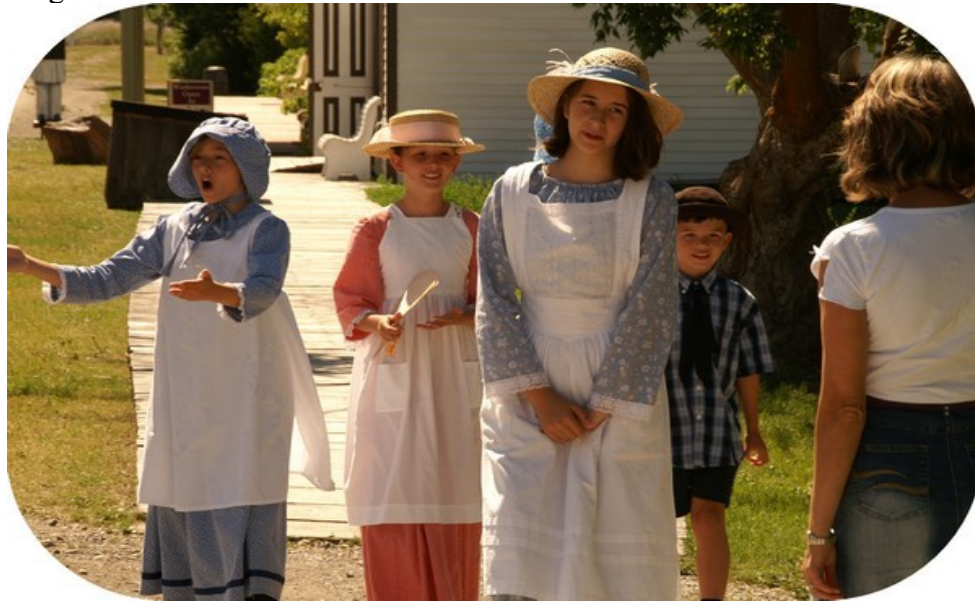
Stemmingsbillede fra Fort Steele.

Vi havde ikke kørt ret længe, før vi fik øje på et kæmpe hjul af træ, måske et hjul brugt til minedrift. Vi drejede fra vejen og kom ind til Fort Steele, et levende museum a la Den Gamle by i Århus. Her var bygninger samlet fra flere dele af Canada, og alle huse var i meget pæn stand, og de fleste af dem fuldt indrettet og levendegjort. Smeden var i gang med at sko en hest og i købmandsbutikken blev der langet varer over disken. Flere personer var klædt i gamle dragter og gik rundt og lavede gadeskuespil. Denne levendegørelse gav en vældig god stemning, og vi fik lidt indtryk af, hvordan folk har levet før i tiden. Der kom et brudepar kørende med hestevogn gennem byen, det var ikke skuespil, men derimod den ægte vare. Vi spurgte en af gæsterne og fik at vide, at stedet var almindeligt brugt til vielser.